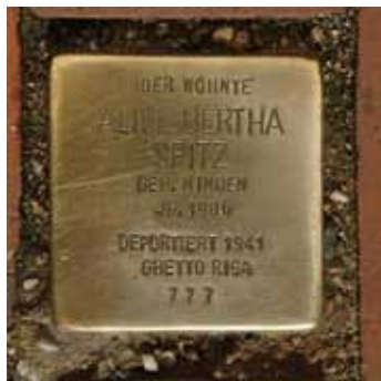
Jg. 1906 Deportiert 1941 Ghetto Riga ???