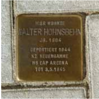
Jg. 1904 Deportiert 1944 KZ Neuengamme MS Cap Arkona Tot 3.5.1945