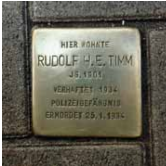
Jg. 1901 Verhaftet 1934 Polizeigefängnis Ermordet 25.1.1934