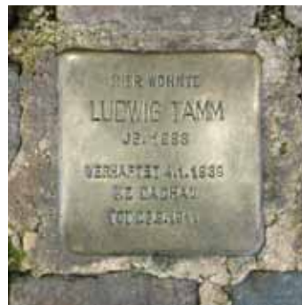
Jg. 1883 Verhaftet 4.1.1939 KZ Dachau Tot 23.9.1941