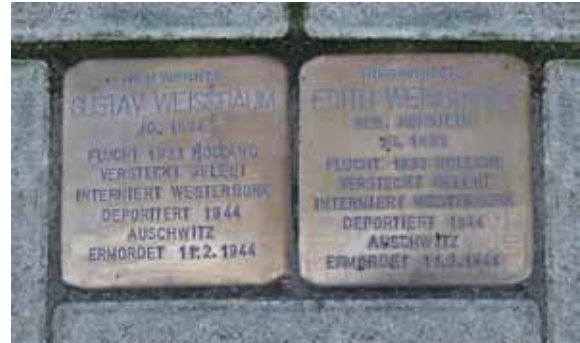
Jg. 1894 Deportiert 1944 Ermordet im Konzentrationslager Auschwitz 11.2.1944