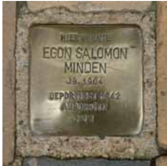
Jg. 1904 Deportiert 1942 Auschwitz ???