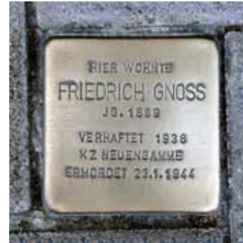
Jg. 1889 Verhaftet 1939 KZ Neuengamme Ermordet 23.1.1944