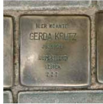
Jg. 1908 Deportiert Izbica ???