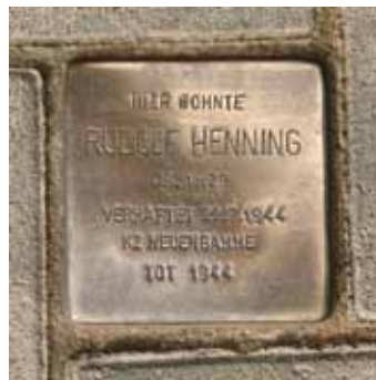
Jg. 1879 Verhaftet 22.7.1944 KZ Neuengamme Tot 1944