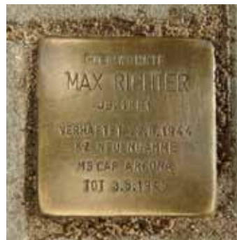
Jg. 1881 Verhaftet 22.8.1944 KZ Neuengamme MS Cap Arkona Tot 3.5.1945