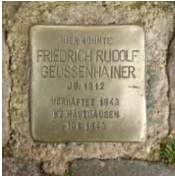
Jg. 1912 Verhaftet 1943 KZ Mauthausen Tot 1945