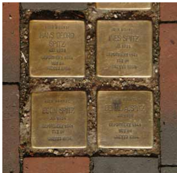
Jg. 1934 Deportiert 1941 Tot im Ghetto Riga