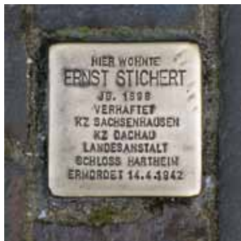
Jg. 1898 Verhaftet KZ Sachsenhausen KZ Dachau Landesanstalt Schloss Hartheim Ermordet 14.4.1942